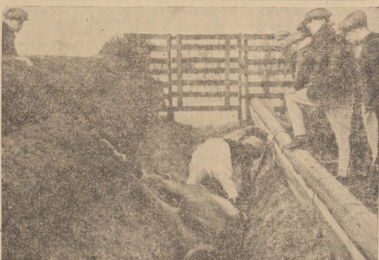
FATALNY SKOK PRZEZ PRZESZKODĘ

Z całą stanowczością stwierdzamy, że autor tego artykułu umyślnie wypaczył dobrą wolę i twórczą inicjatywę prywatnych czynników społecznych, którym leży na sercu dobro rozwoju radja, tego potężnego ośrodka kultury i cywilizacji.