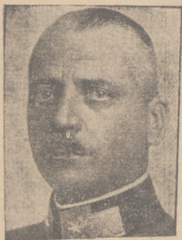
Nowomianowany szef sztabu austriackiego marszałek polny Jansa.

WIEDEŃ, 2.4. (tel. wł.) W dniu wczorajszym związkowy rząd austriacki ogłosił ustawę o powszechnej służbie wojskowej na terenie państwa austriackiego.