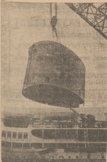
Montowanie olbrzymiego kotła na statku transoceanicznym.