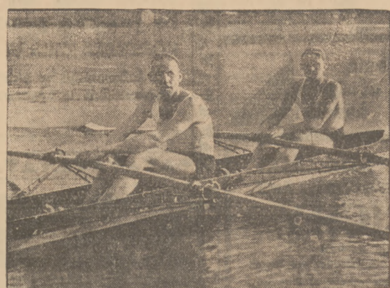
NASI OLIMPIJCZYCY TRENUJA

Do biegu stanęło 10 zawodników; pierwszy przebył trasę Nobiatek „Sokół” Ruda w czasie 17.05.6 m. zawodnik „So-