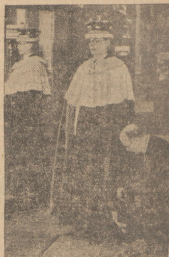
Angielscy lordowie są b. przewidujący i już obecnie szkułi oni togi, w których wystąpią podczas uroczystości koronacyjnych króla Edwarda VIII, jak wiadomo, termin koronacji ustalony został na miesiąc maj roku przyszłego.

Statystyka powyższa jest raczej wymownym świadectwem tego, iż na przestrzeni ostatniego 1000 lat Europa niestety pokoju nie zaznała.