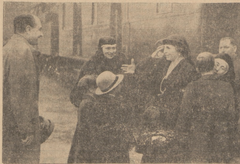
Królowa Marja, matka obecnego króla rumuńskiego Karola, przybyła wraz ze swoją siostrą księżną Hobenloc do Białogrodu. Na zdjęciu mała królowa Marja (środek), po prawej królowa Marja jugosłowiańska, w środku królowa Marja rumuńska. Z boku, po lewej stronie książę Paweł, jeden z regentów Jugosławji.