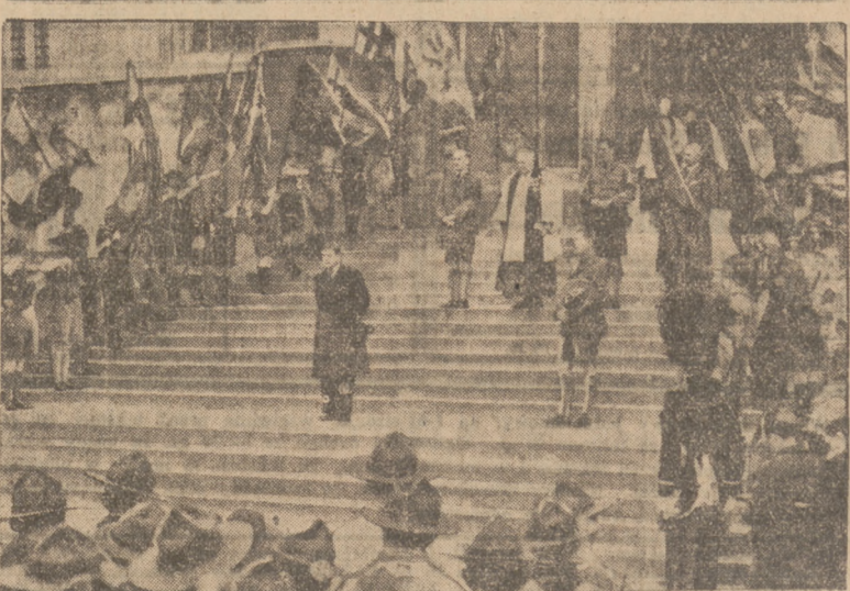
Król Edward VIII, ze stopni kaplicy św. Jerzego w Windsorze przemawia do przedstawicieli harcerstwa, którzy zjechali się na w szechszwałowy zlot harcerzy do Anglii.

Organizatorzy przewidują cały szereg nagród w każdej grupie zgodnie z regulaminem.