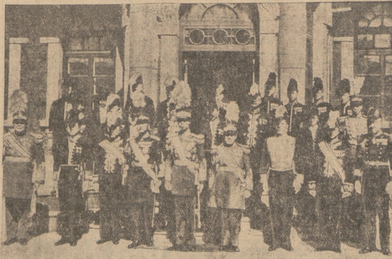
Cesarz mandżurski Juji przyjmuje nowego ambasadora japońskiego.

KORZYSTAJCIE z TANICH RYCZAŁTÓW KĄPIELOWYCH ŻĄDAJCIE BEZPŁATNYCH PROSPEKTÓW DYREKCJA ZAKŁADU KĄPIELOWEGO.