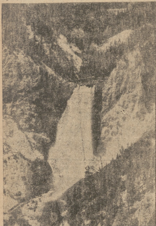
Przez słynny amerykański park Yellowstone przepływa rzeka o tej samej nazwie. W pewnym miejscu tworzy ona wspaniałą wodospad znacznie wyższy aniżeli wodospad Niagara.