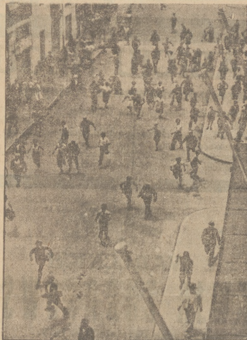
ŻYDOW NIE CHCĄ W PALESTYNE

Puder BEBE SZOFMANA CHŁODZI, KOI USUWA ZAOGNIENIA U DZIECI