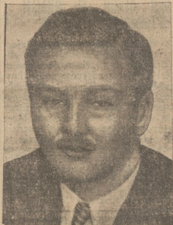
Po śmierci króla Egiptu Fuada, tron obejmie książę Farouk.