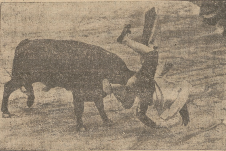
GDY KOBIETA STANEŁA DO WALKI Z BYKIEM

Delegacja powróciła już do Zawiercia. Przywiezione przez nią wiadomości wywołały dużą radość wśród byłych robotników fabryki.