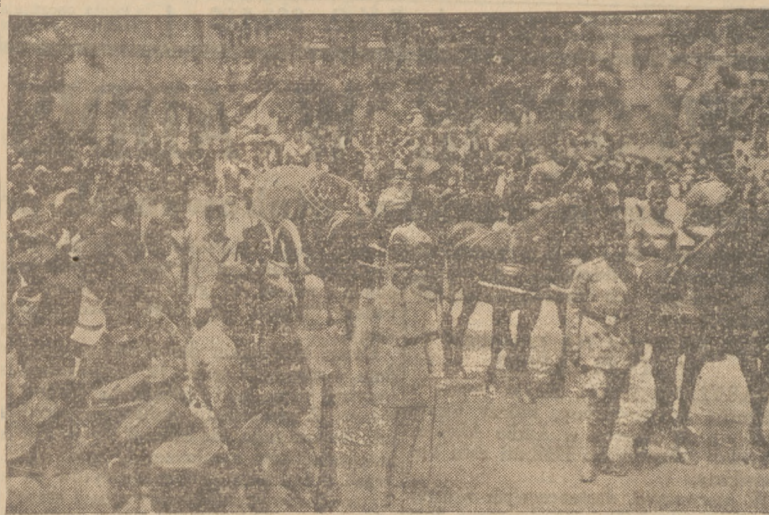
POGRZEB KRÓLA EGIPTU FUADA W KAIRZE

żydów z gmachu wznosili oni okrzyki zapowiadające odwet za ataki narodowców na żydowskie pochody 1 majowe.