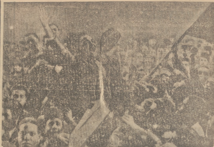
W dniu wkroczenia wojsk włoskich do Addis Abeby odbyło się uroczyste posiedzenie parlamentu w Rzymie, na którym Mussolini wygłosił wielką mowę. Na ilustracji moment przemówienia Mussoliniego (stoi w drugim rzędzie trzeci od lewej)