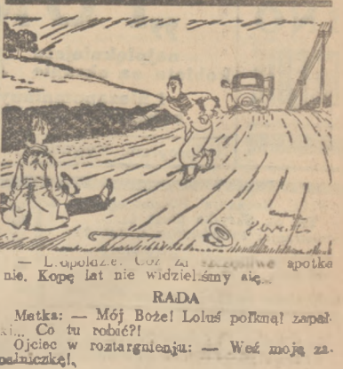
— Lapolaze. Co za straszna apokalipsa. Koje lat nie widzieliśmy się... RADA Metka: — Mój Boże! Lotuś poknął zapal... Co tu robić? Ojciec w rozgarzaniu: — Weź swoją zaopieczkę!

ich wyprowadzać. Wiele osób uległo nerwowym wstrząsom. W wielu domach w tym czasie nie było nikogo, w innych zostały same kobiety i dzieci. W trakcie gaszenia ognia szereg obywateli wykazał dowody wielkiego poświęcenia. Harcerze wynosili na rękach całe rodziny żydowskie wśród gwałtownego dymu. Jednocześnie do walki z żywiołem poza strażą ogniową stanęli policjanci, żołnierze i oficerowie. Spłonęło ogółem około 150 budynków zgrupowanych na terenie 70 posesyj. Dach nad głową straciło około 1500 osób. Straty materialne wynoszą około pół miliona złotych.