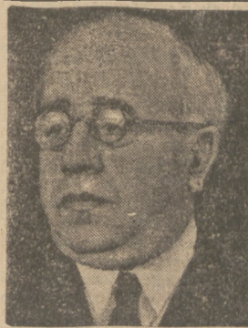
AZANA PRYZYDENTEM HISZPANII Sołtysi i komuniści hiszpańscy wysunęli jako kandydata na prezydenta preta, Azanę.

WYŁOSOWANE BONY FUNDUSZU INWESTYCYJNEGO. Urząd długów państwa komunikuje, że w dn. 7 maja 1936 wylosowane zostały do umorzenia bony Funduszu Inwestycyjnego oznaczone Nr. Nr. 1132, 11877, 15412, 21878, 25662, 34356, 35952.