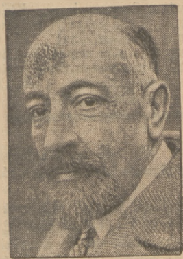
B. minister francuski Daladier zmarł. Był wielokrotnie ministrem pracy i po wojnie światowej ministrem poczty

Na czele nowego rządu abisyńskiego stoi były gubernator A. A. Abebe ras Ygazu.