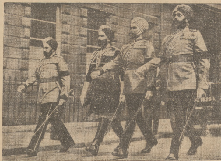
ADJUTANCI KRÓLA EDWARDA VII

Nie jest też obojętne, że twarde politykę uzasadniają Włosi brakiem „przestrzeni” — faktem, który smacznie dzisiaj jest rzeczą wielce popularną, jak m. in. świadczy o tem nie miecki na to termin „Raum-Not”. Podwójnie więc niebezpieczne, jeśli motywów w polityce znaleźć miałyby rychło naśladowców.