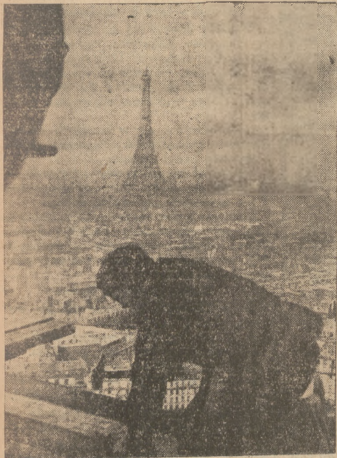
MIEDZY NIEBEM A ZIEMIĄ

Naprawa kopuły na Domie Inwalidów w Pa- ryżu wymagała nie tylko uzdolnienia fachowe- go, lecz również zimnej krwi.