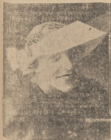
OSTATNI KRZYK MODY — KAPELUSZE ZE SZKŁA

W ten sposób każdy był poinformowany o swoim sąsiadzie czy sąsiadce i wśród zaproszonych gości zapanował od razu ożywiony nastrój i rozmowa. Wynalazek ten nosi cechy bardzo nowoczesnej, zrącalizowanej kultury towarzyskiej i wątpić można, czy przyjmie się on na gruncie innym niż amerykańskim.