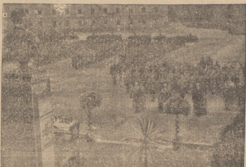
ŚWIĘTO WOJSKOWE W POZNANIU

Następnie, w związku z ustawami z dnia 21 kwietnia 1936 r., którymi ustalono stosunek państwa do związków religijnych muzułmańskich i karaimskiego w Rzeczypospolitej. — Rada ministrów uchwalała dwa rozporządzenia o uznaniu statutu tych związków. Statuty te są prawem wojakowym tym wyznacznym, wymagają jednak w myśl art. 115 konstytucji uznania państwa. Uchwalenie tych rozporządzeń jest końcowym etapem w uregulowaniu statusu prawnego obu związków.