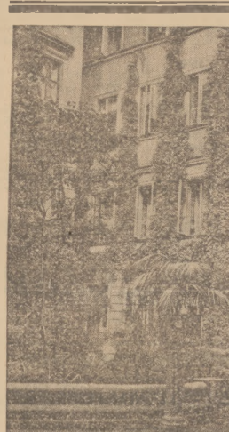
Magistrat w Warszawie chce, przyzwyczajając mieszkańców do dekoracji ławiatami domów, rok rocznie organizację konkursu na najpiękniejszą dekorację domów. Oto podwórta jednego z domów w obramowaniu krzewów i pączych roślin.

Na powyższych sprawach wyzysmowania zosiał porządek obrad onedającego miejskich szkół powozachnych, kwoty