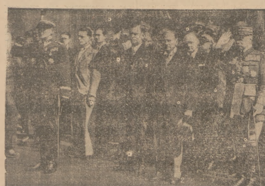
Gen. Śmigły-Rydz w otoczeniu wybitnych osobistości francuskich salutuje, podczas gdy orkiestra gra hymn narodowy.

ROK XXVII Czwartek 3 września 1936 r. Nr. 240 Wiersz Redakcji i Administracji: Warszawa, Piłsudskiego 4. Telefon: Red. 94. Adm. 73. P.K.O. 302.712 Prenumerata miesięczna z odnośnikiem do domu i przesyłką pocztową 2.50 Opłata poczt. skazana ryczałem.