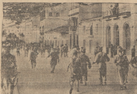
PO ZAJĘCIU ARACENY PRZEZ POWSTAŃCÓW Moment wkraczania wojsk powstańczych do zdobytego miasta Aracena w prow. Huelva.

Oficerowie skazani w ubiegły piątek przez trybunał ludowy na karę śmierci zostali wczoraj rozstrzelani.