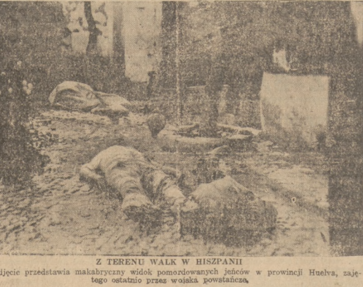
Z TERENU WALK W HISPANII Zdjęcie przedstawia malarzy wojny pomordowanych jeńców w prowincji Huelva, zajętej ostatnio przez wojsko powstańcze.