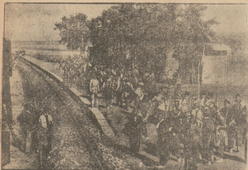
PRZED ROZSTRZELANCIEM W HISZPANII

Oddziały milicji ludowej obecnie koncentrowane są w stolicy, o którą rozstrza się zapewne decydujący o losach Hiszpanii boj.