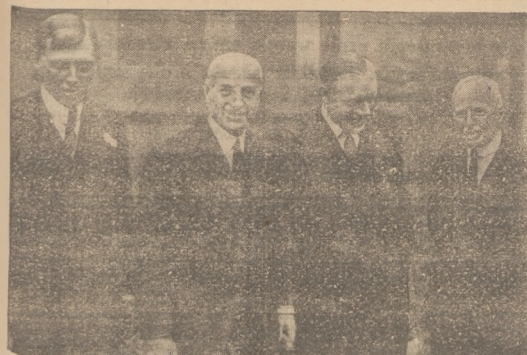
OBRADY ANGIELSKICH KONSERWATYSTÓW odbite w ub. tygodniu w Margate skupili leaderów partii sir S. Hoare, lordem Ebbisham, Elliotem i G. Lloyd'em na czelu.