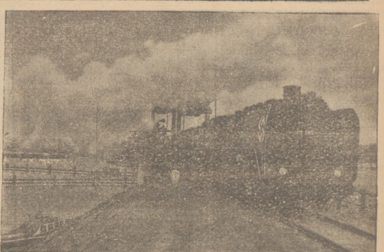
RUGIA NIE JEST JUŻ WYSPA W ostatnich dniach wyspa Rugia, położona na morzu Bałtyckim, połączona została mostem kolejowym ze stałym lądem niemieckim. Na zdjęciu pierwszy podjazd wylotu nowego mostu