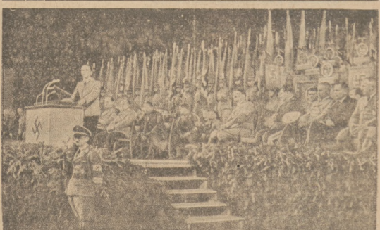
W Berlinie zostały otwarte w tych dniach przez kanclerza Hitlera obrady Akcji walki z głodem i chłodem.

Początek seansów o godz. 5.30, 7.30, 9.30