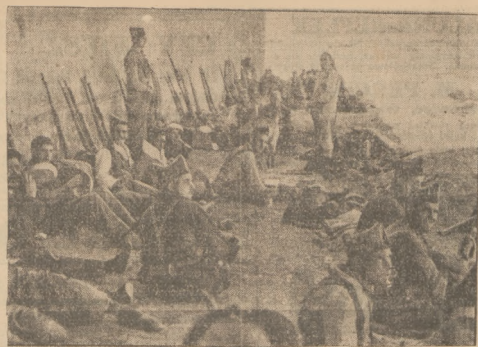
W oczekiwaniu na generalny atak sił powstańczych na Madryt, wojska rządowe skoncentrowane zostały w stolicy.