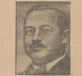
NOWY PREMIER WĘGIER Po śmierci premiera Goemboesa, między innymi nie powraca znowu do pracy. (Lewy).