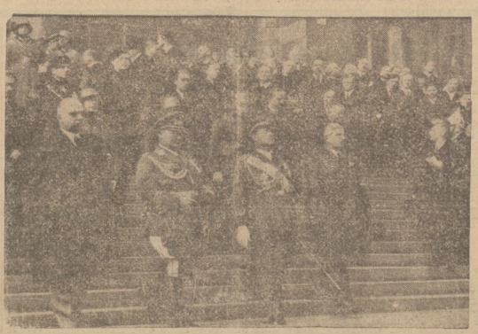
OSTATNIA DROGA PREMIERA GOEMBOESA W pogrzebie premiera Węgier gen. Goemboesa wzięli udział: premier Rzeszy Goering, hr. Ciano oraz kanclerz Schuschnigg.

Wczorsem puszczono wodę na przeciąg godziny. Burmistrz Madrytu wyszł do ludności przemówienie przez radio, zalecając oszczędne używanie wody.