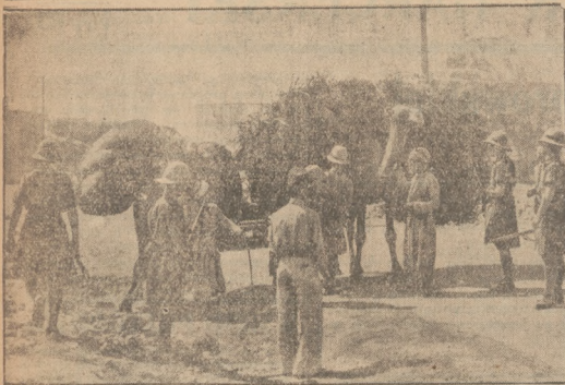
W Palestynie specjalne posterunki wojsk angielskich przeszkadzają aktywnie wojsk arabskie udające do miast, co do których istnieje i dezerterstwo przemycania broni.