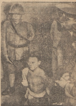
ZAGNIENIE SYTTACH NA DALEKIM WCHODZIE

WARSZAWA, 20.10 (tel. wł.). Od pewnego czasu w prasie partyjnej ukazują się różne, przeróżne wiadomości o tem, jak rzekomo ma być zorganizowany tak nazywany przez tę prasę „Obóz Czynu Państwowego”, jako swoy obóz, którego organizacją opracowywana jest przez komendanta Pw. legionistów płk. Adama Koca. W związku z tym przedstawiciel urzędowej agencji prasowej otrzymał wyjaśnienie od płk. Koca, w którym oświadcza, że wszystkie plotki jakie co-dziennie pojawiają się w prasie nie odpowiadają prawdzie, a pochodzą stąd, że szereg ludzi dobrej woli nadałszy różne projekty, które przedostają się do dzienników. (Na str. 3 z obowiązku dziennikarskiego zamieszczamy uwagę o obozie płk. Koca, który jest głównym zainteresowaniem prasy - Red.).