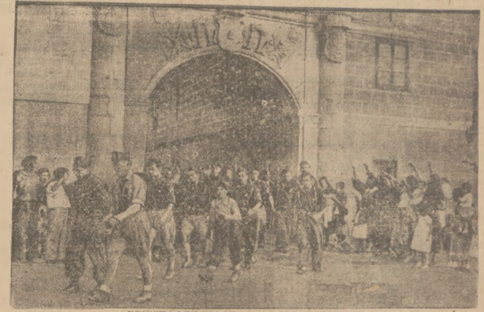
POWSTAŃCY MASZLARZA NA MADRYT Zdążające na Madryt oddziały powstańcze zęga ludność miasteczka Arlanzon.