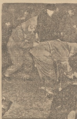
PARYŻ PRZYGOLOWUJE SIĘ DO OBRONY PRZECIWOŁOŹNICZEJ W Paryżu odbyły się próbie alarmu przeciwżaglowców, których zadaniem było przygotowanie ludności do stanki nieprzyjacielskich wojsk lotniczych. Próby te zostały zakończone przez komunistów, którzy w czasie nakazanych ćwiczeń, wypuścili rakiety świetlne.