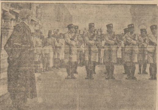
W Palestynie zakończony został smeralny strzał arabów, trwający od pół roku. W związku z tym odbyło się w Jaffie uroczyste zwłonięcie działo normalnych sądów, które w czasie rozruchów zawieszony był działalność na rzecz sądownictwa wojskowego.

Wczoraj o godz. 11 sąd ogłosił prawce, po której miało orzeczenie, iż dalszy ciąg procesu kontynuowany będzie przed Sądem okręgowym w Sosnowcu, gdzie nastąpią wydany wyrok. Proces wznowiony będzie w nadchodzący czwartek.