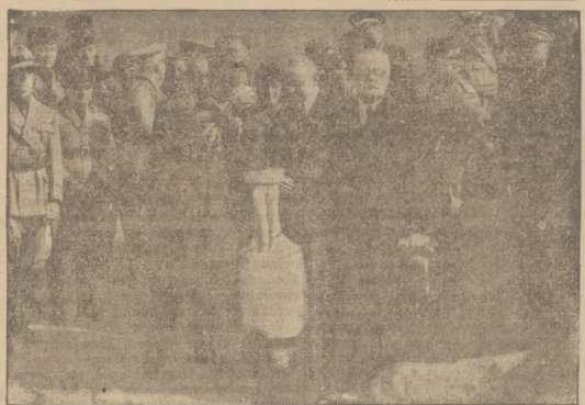
ZIEMIA RZYMSKA NA KOPIEC MARSZAŁKA Delegaci wiolekich lombantów zlecił na Swięcia zardzi zmieli z Palatyn. Na zdjęciu członkowie delegacji wraz z posłem polskim w Berlinie w chwili pobierania ziemi.

Następnie przewodniczący zwraca się z pytaniem do biegłych, czy znają nazwę Nyczów, na co otrzymuje od-