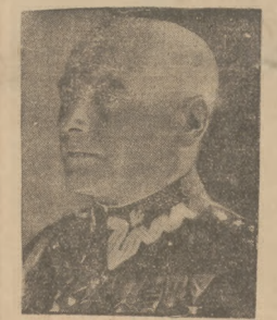
GEN. EDWARD ŚMIGŁY-RYDZĘ

listopada r.b. z okazji wstąpienia do WARSZAWA, 24.10 (tel. wł.). Szczę-