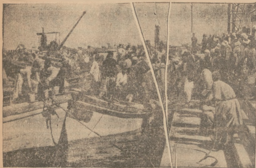
Podczas przerwy, zakończony został w Palestynie generalny strajk arabów. Na tymburach po ogłoszeniu zakreślonej strajku parzy zarządy się od przedsiębiorców i robotników arabskich.

Podaje się do wiadomości P.T. Odbiorców, że z dn. 24.10 numer telefonu do sklepu Elektrowni przy ul. Dęblińskiej 1 będzie następujący: tel. 6-28-54.