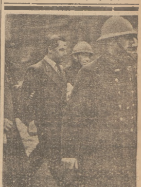
WÓDZ „REKISTOW” BELGIJSKICH DEGRELLE

Oczekiwano należy, że przysłażą sepa parlamentarna, która odbiera się 5 listopada, będzie dość burzliwa, i że obecny gabinet będzie przedmiotem ostrej napaści ze strony opozycji.