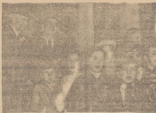
ST. ZJEDNOCZONE POD ZNANIEM WYBORÓW PREZYDENTA