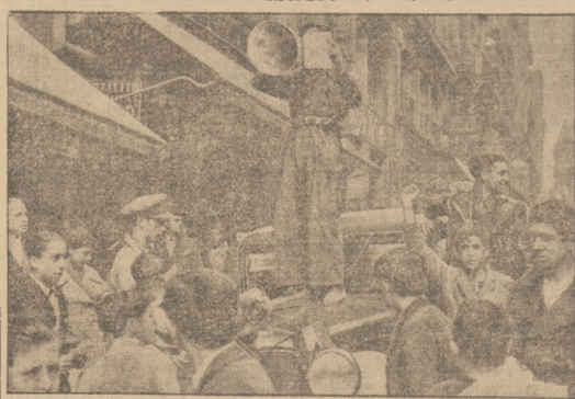
Na ulicach Madrytu pojawiają się domorodni agitatorzy, nawołujące do występowania w szeregi milicji ludowej.

Poza tym wszystkim Radosz bieżąc jeszcze odpowiadał za fałszywe (skarżenie Stefani Kiljan o przywłaszczenie 100 zł.