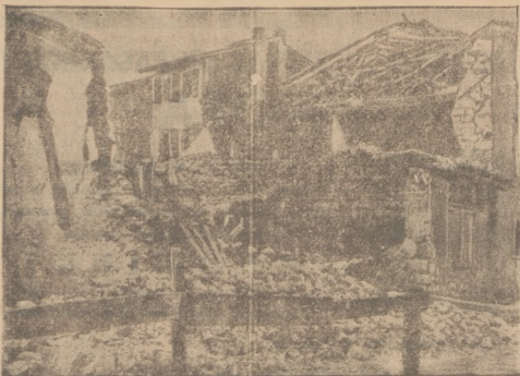
Polacy Wenecji nawiedziło ostatnio trzęsienie ziemi, podlegając za sobą dziesiątki śmiertelnych ofiar w ludziach.