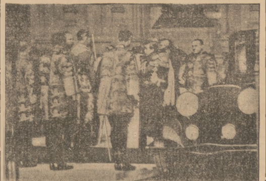
Król Edward VIII opuszcza gmach parlamentu, po dokonaniu otwarcia sesji.

Deficyt w październiku r. ub. wynosił 27,9 mil. zł. Osiągnięcia w październiku rb. nadzwyką w kwocie 1.348 tys. zł. pokryła niewielki niedobór ubiegłych miesięcy, tak że okres od kwietnia do końca października zamknął się nadzwyką 454 tys. zł.