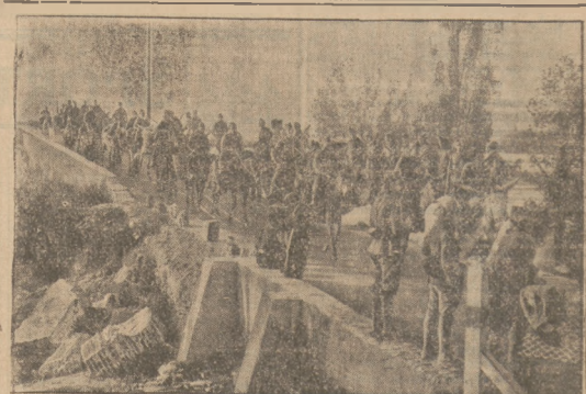
Wojak powstaniec na przedmieściach Nawalcarnera, przygotowują się do generalnego ataku na Maszty.