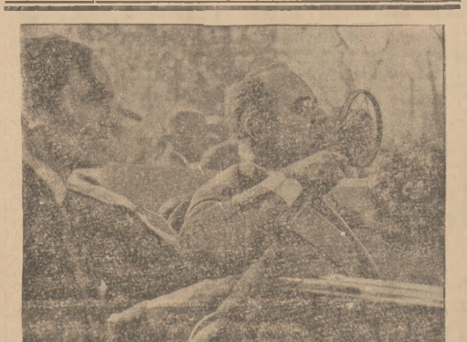
Prezydent Stanów Jędrzejowski w czasie wygłaszania ostatecznej mowy przed wyborami, które przyniosły mu wielkie zwycięstwo.

Skradzione 600 zł. odebrano od zatrzymanego złodzieja w całości. Zatrzymanego Zaleskiego przekazano do dyspozycji władz sądowych.