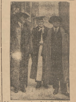
Sekretarz generalny Ligi Narodów Avenol (na prawo) wraz z kłoni amerykańskim w Londynie BINGHAM (na lewo) zostali mianowani równocześnie doktorami h. c. Uniwersytetu oksfordzkiego. Zdjęcie przedstawia obu scientistów w towarzystwie rektora Uniwersytetu

Orzwyście w związku z tymi wizytami aktualna się stanie sprawa rewizyty dostojników polskich w stolicy sojuszniczej Rumunii. Z pierwszą rewizytą uda się do Bukaresztu minister spraw zagranicznych Beck. Nastąpi to w styczniu lub w lutym, w każdym zaś razie przed wizytą króla Karola w Warszawie.