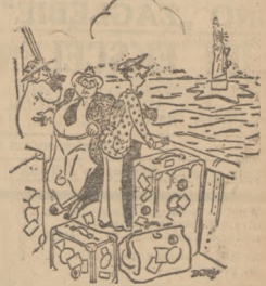
PRZYJĄD DO NOWEGO JORKU

Rybakcy z poszczególnych osad półwysp. Ilijskiego oraz przegów otwartego Bałtyku, którzy w ciągu ostatnich 5 lat usięcy brali udział w destrukcyjnych akcjach śledzi na stródkach (fuznach) polsko - holenderskich powrócili ostatnio do swych domów rodzinnych. Po-