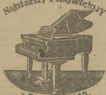
„Rok zał. 1860.”