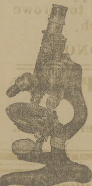
Mikroskopy E. Leitz, Wetzlar

UWAGA: Z pracownią przy ulicy Lelewela o tem samym nazwisku nie ma nic wspólnego moja fabryka. 580