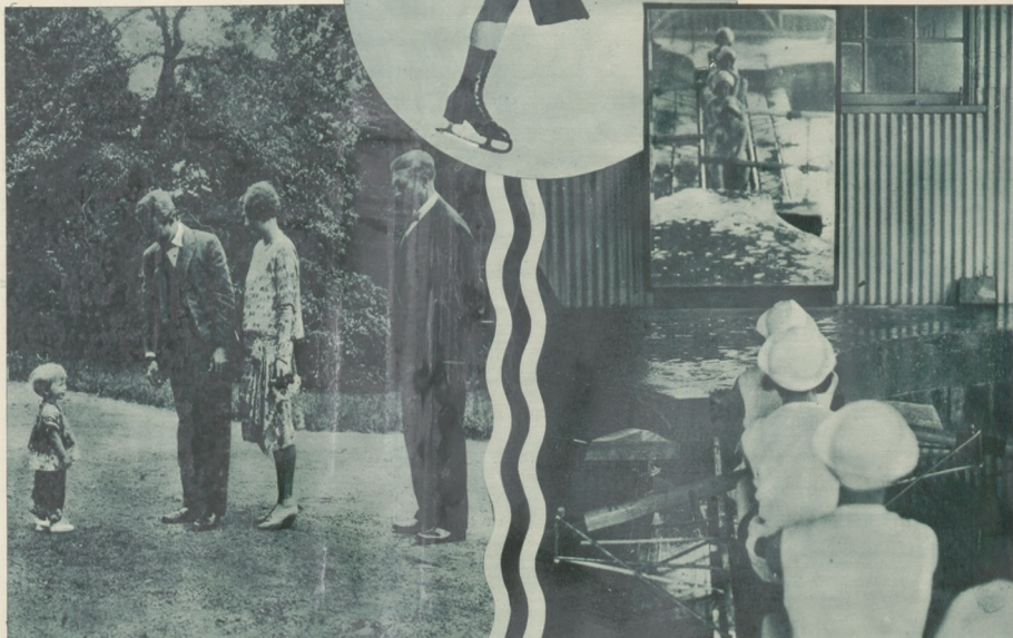
Ciekawa fotografia zrobiona przez królową helgijską a przedstawiająca jej męża króla Alberta, jej córkę Astrydę z mężem ks. Olafem Norweskim i małą wnućką ks. Józefinę w japońskim kostjumie.