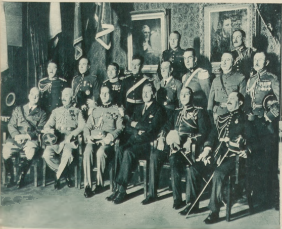
Na lewo: Nowy amerykański minister wojny Patrick J. Hurley przyjmuje sztandary wojskowych obcych państw.