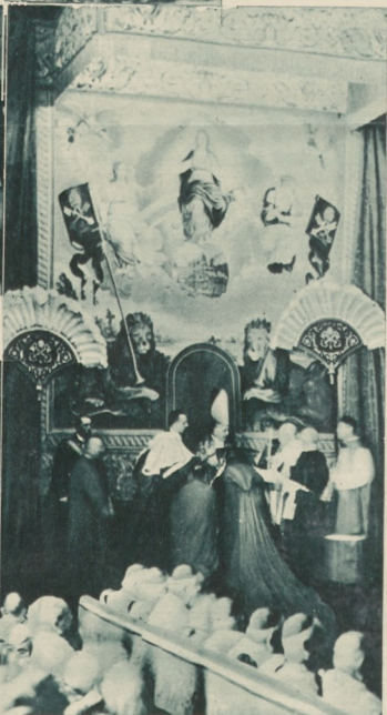
Papież Pius XI śledząc na tronie w ręczu nowomianowanemu kardynałom oznakę ich godności: czerwony kapelus.