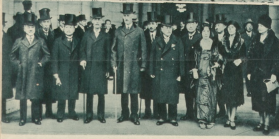
Polnaska delegacja na poranku konferencję rozbrojeniową w Londynie w przejeździe przez Stany Zjednoczone zatrzymała się w Waszyngtonie.