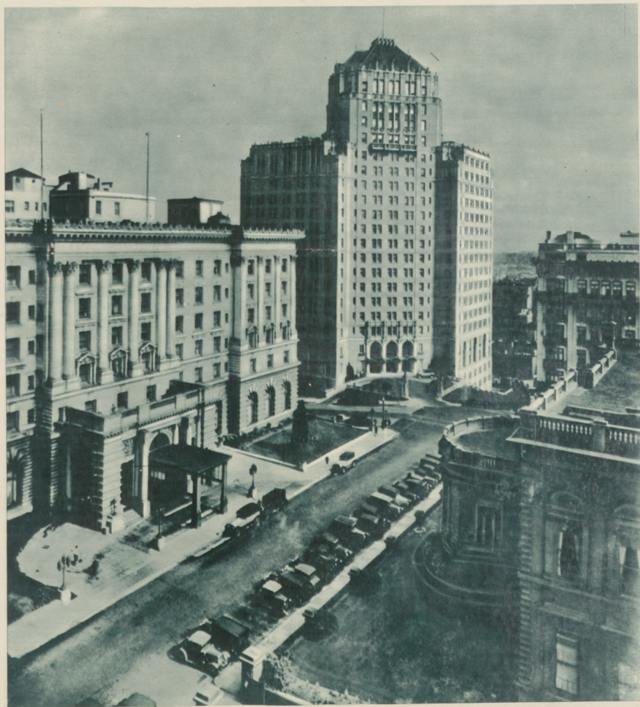
Dzielnica hotelowa w San Francisco, które słynie jest z tego, że posiada najwspanialej wyposażone hotele. Na lewo hotel utrzymany w stylu zamkowym, na prawo w stylu nowoczesnych drapaczy chmur.