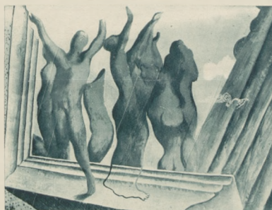
De profundis (temperra).