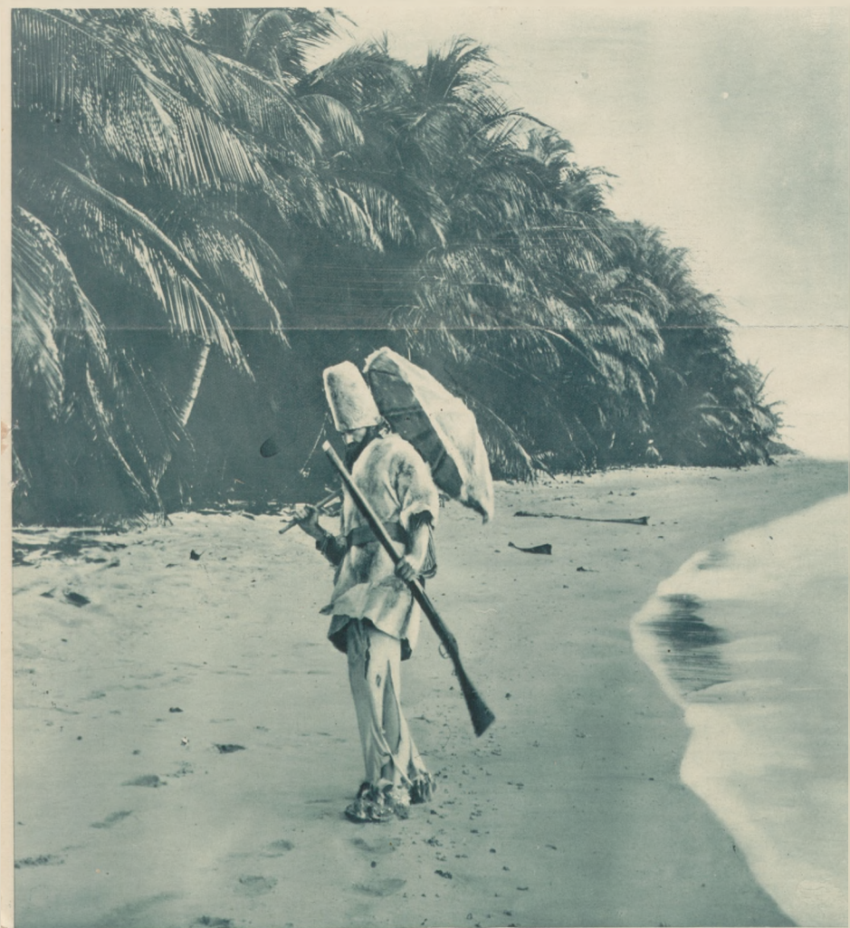
Debrzołny Robinson. Pieszc amerykański Ryszard Hallibarton chce zbadać warunki życia na jednej z niezamieszkałych wysp Dysbelskich, położonych koło Cayenne, spędził na niej 6 miesięcy. Zdjęcie nasze przedstawia go na wybrzeżu wyspy.