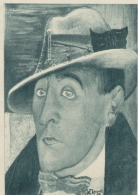
Portret P. J. (ol.).