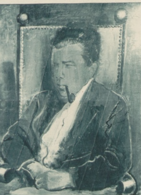
Portret architektki (ol.).