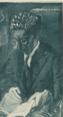
Portret architektki P. K. (ol.).