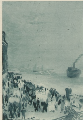
Wieczór letni na Riva Schiavoni (temperra).