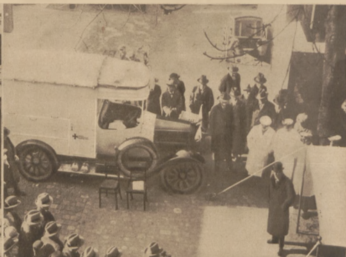
W Frankfurcie wprowadzono auto pogotowia ratunkowego, które jest zarządzane ruchem ambulatorjum chirurgicznym. W razie potrzeby przeprowadza się operację na miejscu wypadku w specjalnym namiocie.