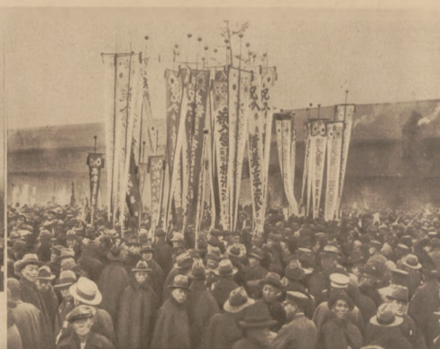
Ohrazek z powołania rekrutów w Japonii.