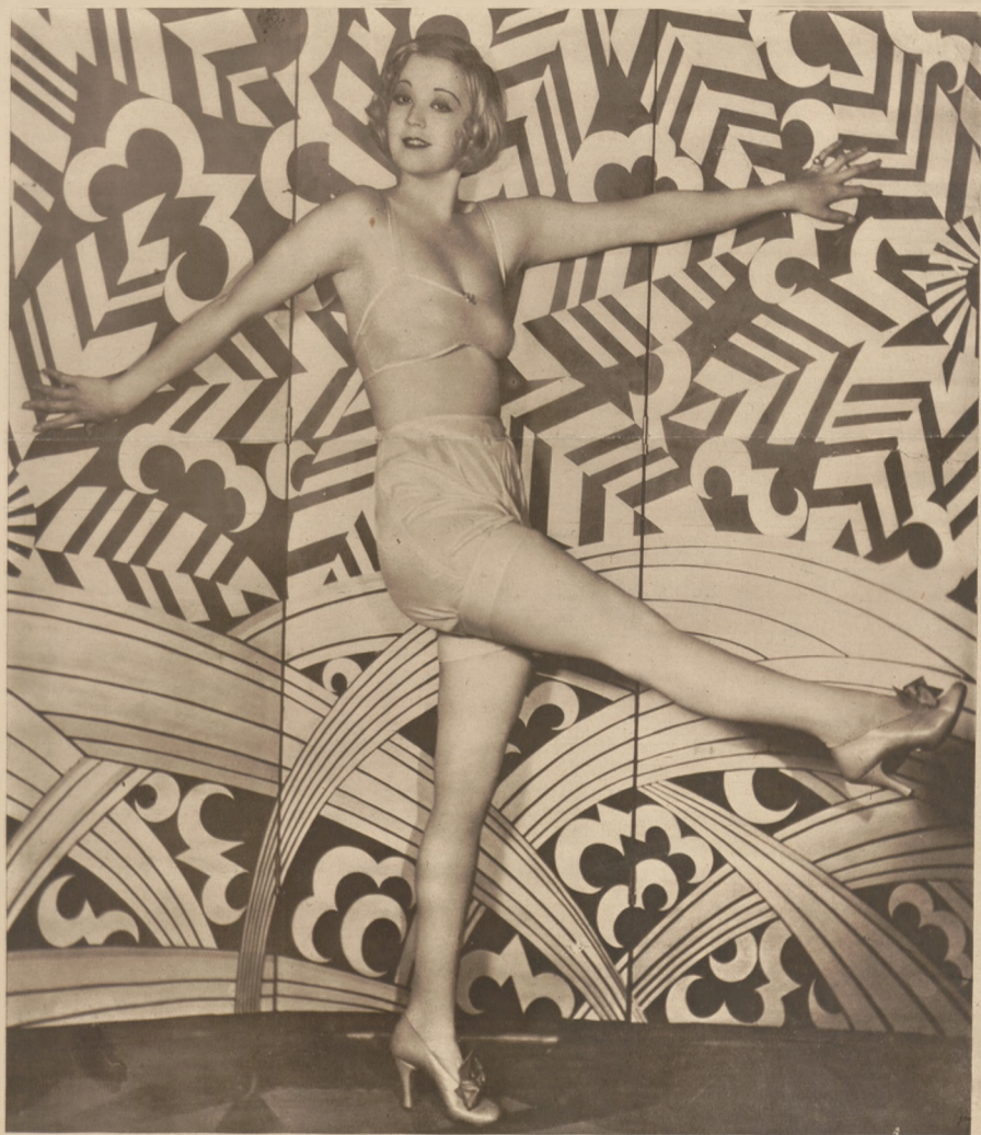
Alice White, nowa gwiazda filmu amerykańskiego.