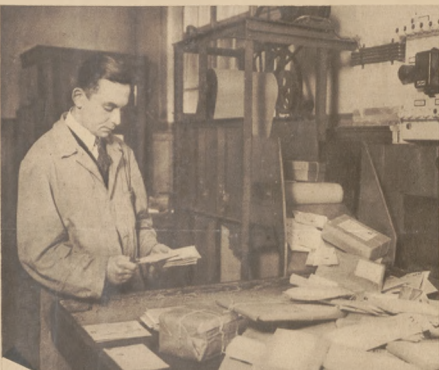
Na poczcie berlińskiej znajduje się skrzynka z ruchomą taśmą, która wrzucając listy znosi odrazu do biura, gdzie się je stępluje.