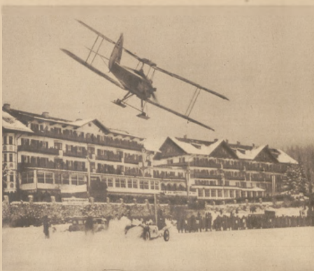
W miejscowości niemieckiej Garmisch-Partenkirchen odbyły się na zamrzniętym jeziorze wyścigi między samochodem i samolotem.