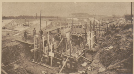
Budowa akwaduktu, lewaru dla rury wodociągowej ponad kolejką piaskową kopalni Juliusz pod Maczkami.