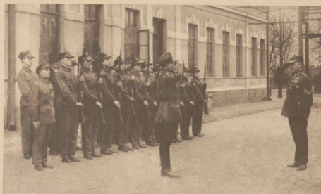
Raport przysposobienia wojskowego w Strzemieszycach.