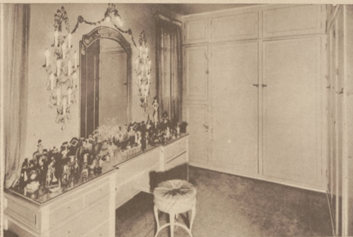
swej posiadłości w Hollywood. U góry na prawo: sanktuarium artystki, buduar i garderoba.