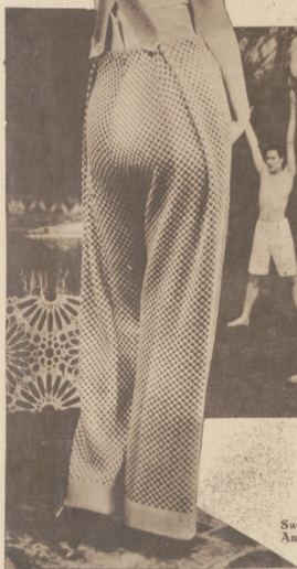
Na lewo: Szobidny strój poranny noszony chętnie przez Amerykanki w słonecznych letniskach Florydy.