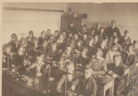
Pracownia przyrodnicza (fizykochemiczna) dla szkół powiatowych w Zawierciu.