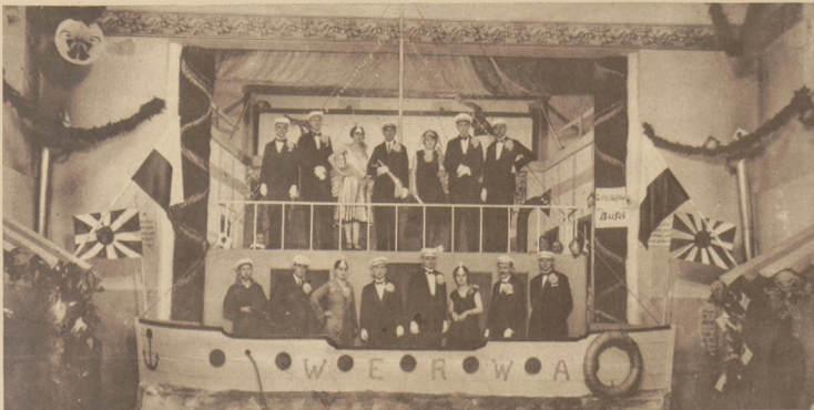
Na lewo: Fragm. z zabawy japońskiej w Olkuszu.