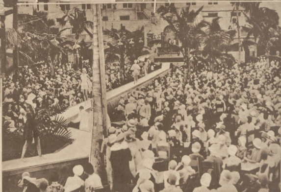
Przegląd mód na wolnym powietrzu w słynnej amerykańskiej miejscowości kuracyjnej Miami Beach.