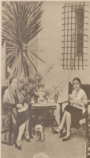
Słynna artystka filmowa Dolores del Río spożywa wraz z matką śniadanie w „patio”