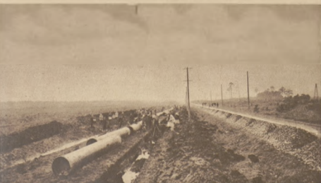
Układanie głównego rurociągu (Górno-Sląskiego) wzdłuż szosy Klimontów-Kazimierz. Średnica rury 750 mm.