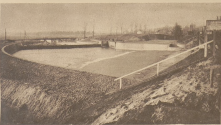
Jazd na rzece Białej Przemysły w Maczkach widziany z mostu kolejowego. Przy prawym brzegu szluzę płciącą i komorę ujęcia wody dla wodociągu.