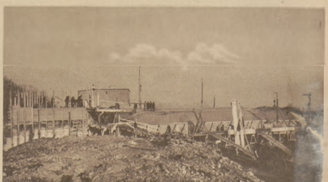
Budowa pierwszej części zbiornika w Zagórzach na pojemność 5000 m 3 wody