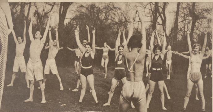
Członkinie „Klubu czcicieli słońca” w Londynie, ćwiczą mimo dotkliwego zimna w blaskach letowego słońca.