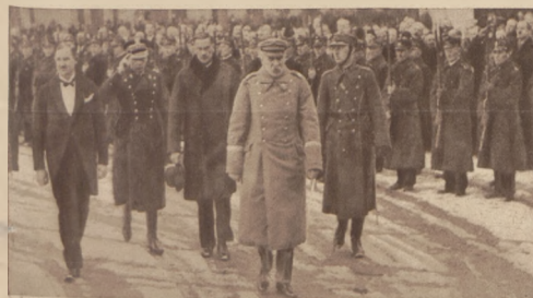
Marszałek Piłsudski przed frontem oddziału przysposobienia wojsk. kolejarzy.