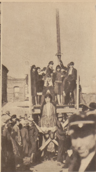
Na prawo: Na ulicach Konstantynopola młodzież turecka bez różnicy płci zabawia się wesoło w święto Damaszku.