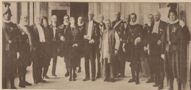
Król szwedzki Gustaf z córką swą ks. Ingrid złożyli wizytę w Watykanie.