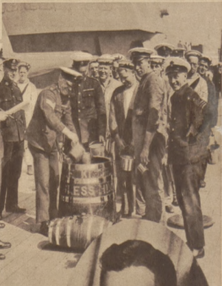
U góry na prawo: Ważny moment: mszynarz angielskiego okrętu wojennego otrzymuje rum.