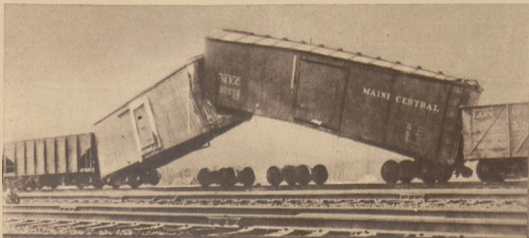
Na lewo: Zdjęcie z katastrofy kolejowej, w której miały oderwać się 2 wagony zostały oderwane od kół podniesione do góry.