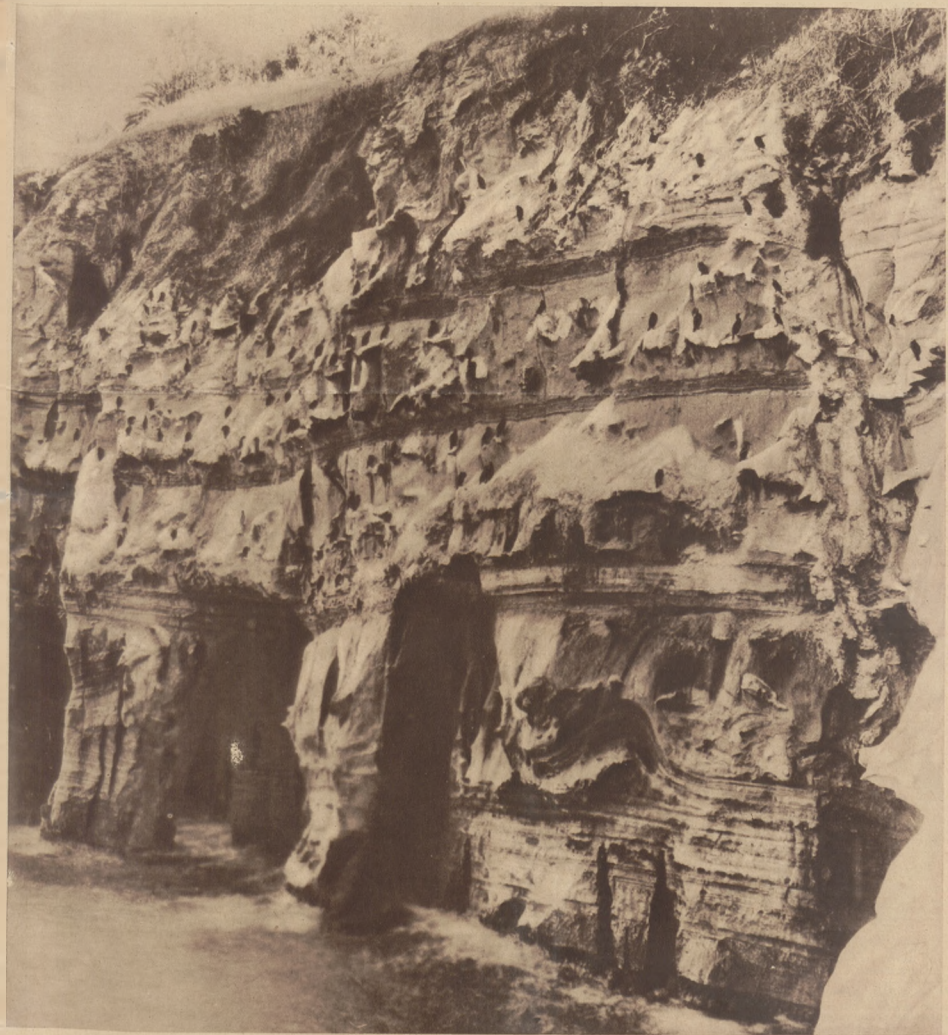
Malownicza skała opadająca w nurty oceanu Spokojnego na wybrzeżu kalifornijskiem służy za miejsce schronienia licznym ptakom kormoranom, żyjącym z połowu ryb.