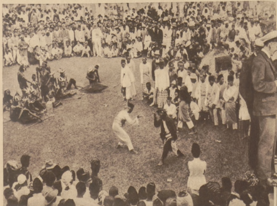
Zdjęcia z uroczystości urządzonej przez sultana Serdangu na Sumatrze z okazji święta ludowego.