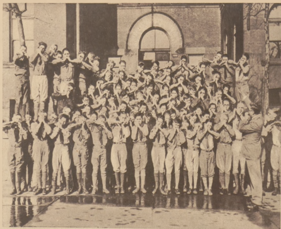
Harczerze z St. Louis (St. Zj.) założyli orkiestrę złożoną z 115 osób grających na wafnych barmonijkach.