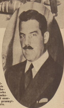
Na prawo: Prezydent największej na świecie policji Grover Whalen z Nowego Jorku musiał ustąpić, rzekomo z powodu zbyt energicznego tępienia przemysłu salkoholu.