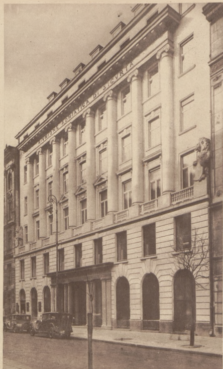
Nowowbudowany gmach Towarzystwa Adriatica dł Si-curia w Warszawie przy alcy Moniarki 10. Uroczystość otwarcia gmachu odbył się w dn. 23 bm. przy udziale przedstawicieli Rządu, korpusu dyplomatycznego, władz samorządowych, a także przedstawicieli wielkiego przemysłu i handlu.