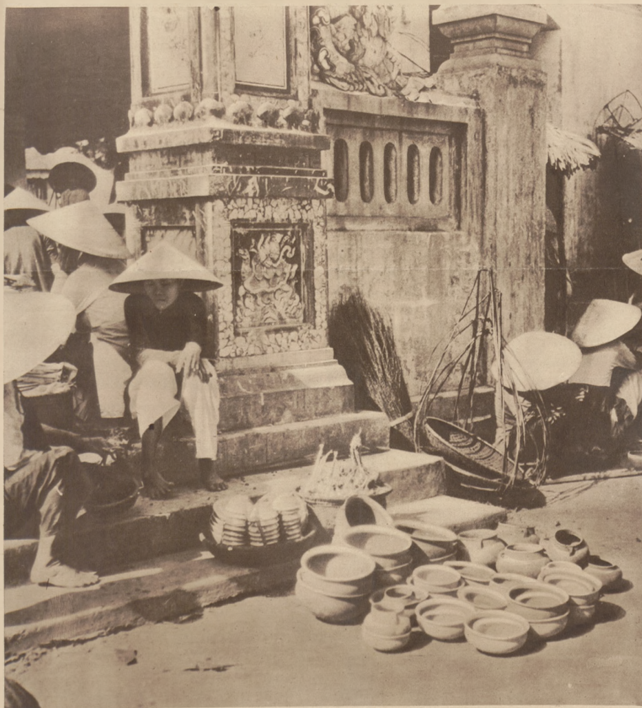
Scena uliczna z Annamu (Indo-Chiny). Handlarze uliczni w charakterystycznych kapeluszach słomkowych wypoczywają w porze południowej na stopniach kwinty.