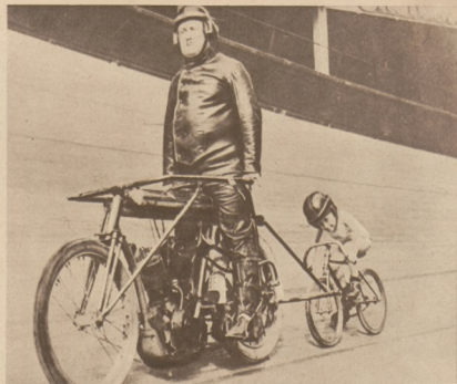
Czego się Jaś nie nauczy za młodu... 4-letni kolarz trenuje na paryskim torze.

Na lewo: Scena przed pałacem królewskim Buckingham w Londynie.