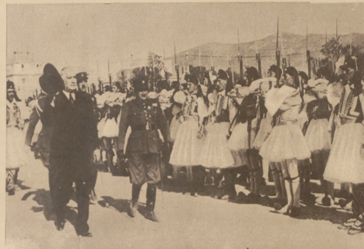
Jrecki minister wojny Sofulas przechodził front kompanji honorowej „Euzonów” w czasie uroczystości 100-lecia niepodległości Grecji

Na lewo: Scena z pochodu w czasie uroczystości półpocia w Paryżu.