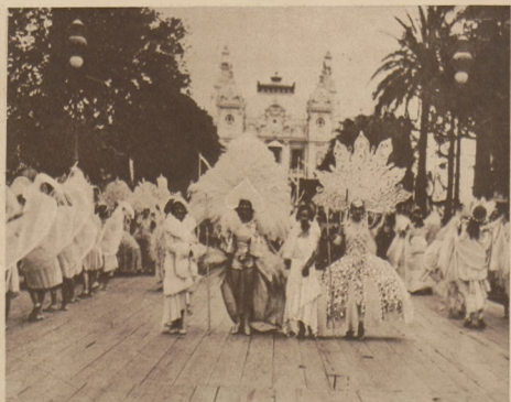
W Monte Carlo odbyło się w zeszłym tygodniu „Święto elegancji”: grupa tancerek w pochodzie.