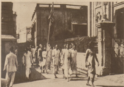
Pierwsze zdjęcia z pochodu Gandhiego do morza. Grupa nacjonalistów hinduskich z Kalkuty przyłącza się do pochodu.

Na lewo: Scena przed pałacem królewskim Buckingham w Londynie.