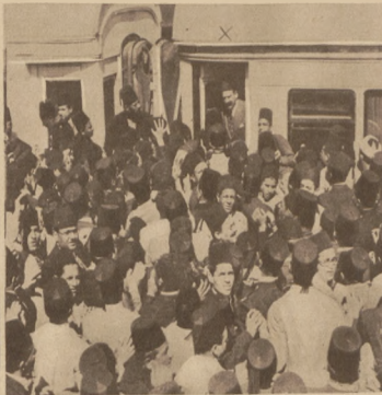
Egiptski prezydent ministrów Nahaş Pasha demonstracyjnie żegnany idąc do Londynu na konferencję mającą zadecydować o stosunku Egiptu do Anglii.