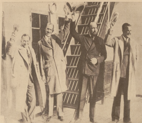
Słynny lotnik amerykański Wilkins powrócił bezpiecznie do N. Jorku po dłuższym pobycie w Antarktydzie, gdzie przedstawił szereg lotów o wielkim znaczeniu naukowym.