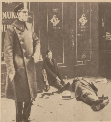
Scena z rozruchów komunistycznych w N. Jorku.