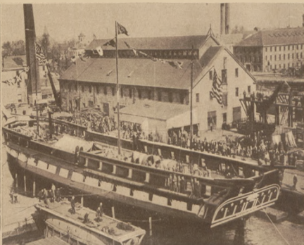
W porcie bosfońskim spuszczone po zrekonstruowaniu słynny okręt „Constitution”, który w amerykańskiej wojnie niepodległościowej odegrał chlubną rolę.

Na lewo: Scena z pochodu w czasie uroczystości półpocia w Paryżu.