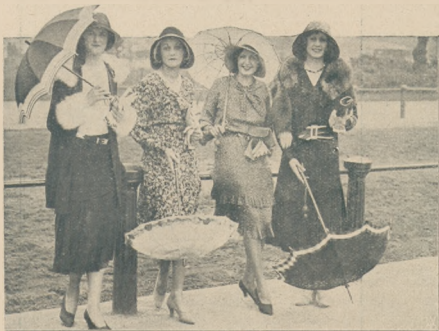
Mody wiosenne. Piękne panie w londyńskim Hyde Parku.