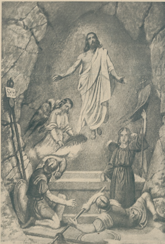
Fl. Cynk pinx.