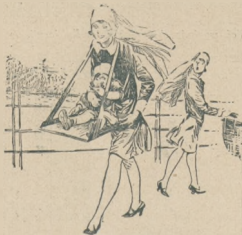
Kiedy sprzedawczyni czekolady zostaje mamą.