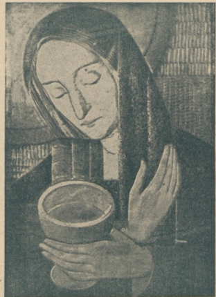
M. Szulc „Madonna” (fresk)