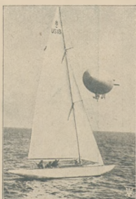
Spotkanie dwu żeglarzy: małego sternowca i jachtu „Angelika”.