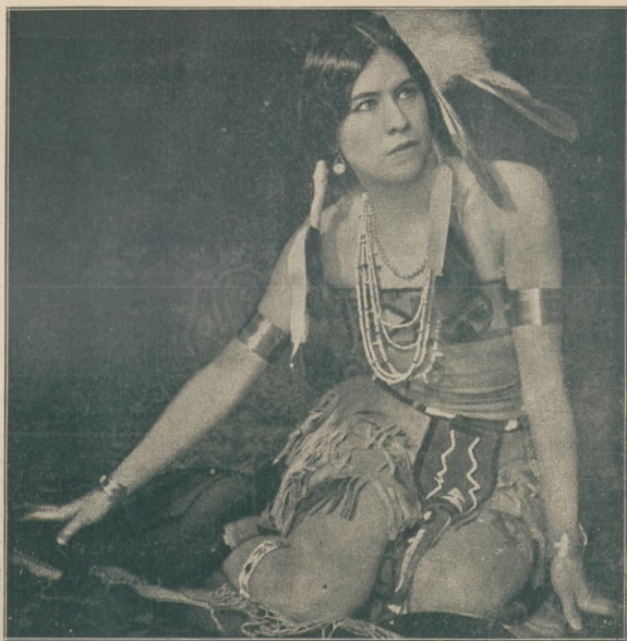
Piękność wśród czerwono-skórych — córka wodza młokanów. Na jej kształtach i tuższy widać pewien wpływ rasy białej.