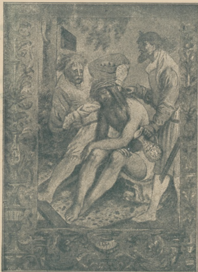
Pojenie Chrystusa ocem (z modlitew- nika Szydlowiec- kich z XV wieku).