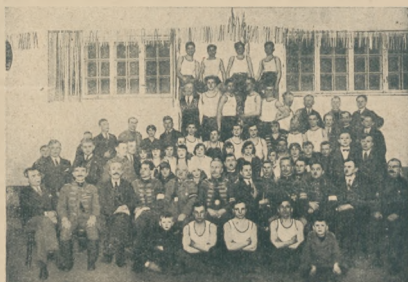
Po ilustracji naczelników, zastępców i instruktoerek Towarzystwa gimn. „Sokół” okręgu Zagłębia Dąbrowskiego, dokonanej w Dąbrowie Górnej, przez naczelnika Związku d-ha Paszowicza z Warszawy.