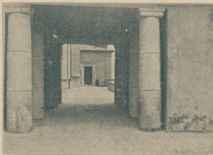
Częstochowa. Fragment z klasztoru jasnogórskiego.