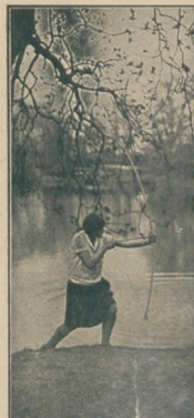
Łuczniczka na treningu w parku Sobieskiego w Warszawie.