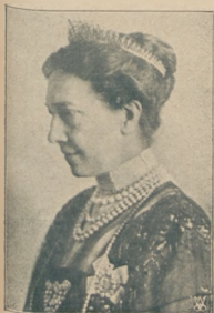
Królowa szwedzka Wiktorja zmarła tu w Włoszech.