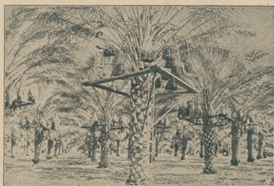
Tak wygląda zbiór daktyli w Kalifornji.

Modne uczesania i wiosenne kapelusiki. Kreowane przez artystki filmowe