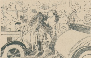
Opowiedz mi dzisiaj bajkę o czerwonym kapturku. Ty mi to wczoraj przyszeleś.