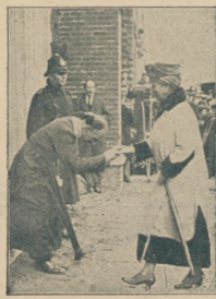
Królowa angielska udaje się do kaplicy w parku Cannig Town.