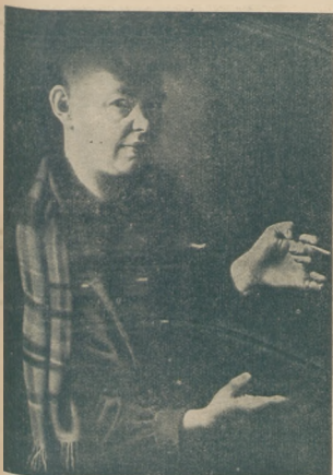
Gotard. Portret pani B.