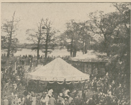
Z Bielan pod Warszawą: Wesołe miasteczko, gdzie żądni rozrywek warszawiacy znajdują moc różnych atrakcji.