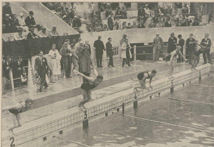
A tak zaczynają zawody pływacy (zdjęcia dokonano w śladonie poryskim).