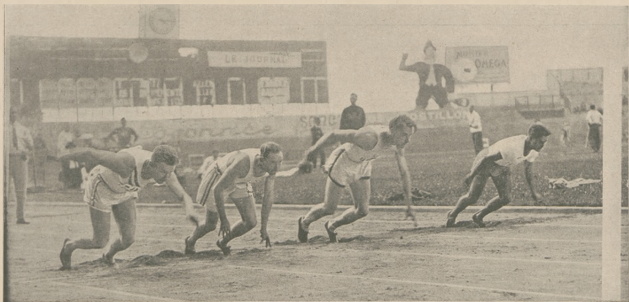
Tak wygląda start do biegu na 100 metrów.