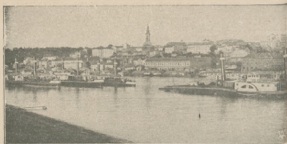
Widok Biłogrodu od strony rzeki Souy.