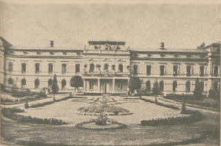
Zazienki solankowe w Ciechocinku.