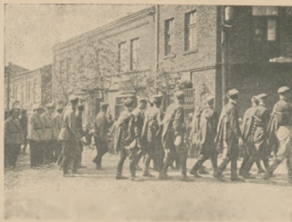
Pochód Sokola i Hallerczyków w dniu 3-go Maja w Grodzcu.