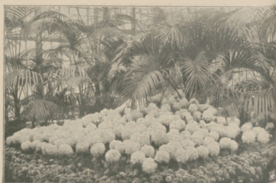
Egzotyczne kwiaty i palmy w oranżerii w Ogródzie Saskim w Warszawie.