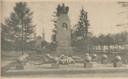
Ciechocinek. Pamiłk Romualda Traugotta.