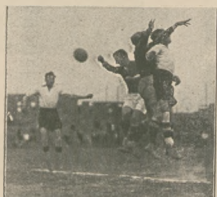
Ciekawy moment gry w piłkę nożną.