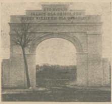
Brama wejściowa do Zakładu Wychowawczego i Szkoły Rzemiosł w Aleksandrowie-Kujawskim.