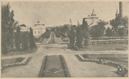
Ciechocinek. Widok z lazienek borowinowych.