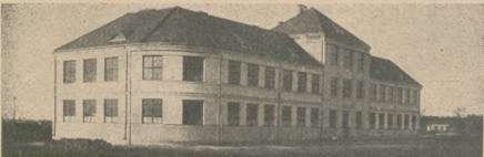
Nowowybudowana 7-mio klasowa szkoła powszechna w Osięcinach, pow. Niezastawskiego.