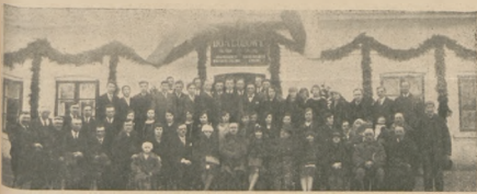
Zakończenie kursów dokształcających przy Ognisku Oświatowym w Czolowie (słuchacze i goście zaproszeni).