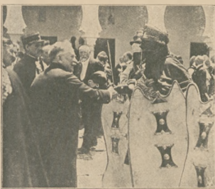
Podczas uroczystości algierskich aszlowie twarogów witają prezydenta Francji Doumergue'a.