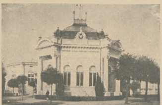
Państwowy zakład zdrojowy w Ciechocinku.