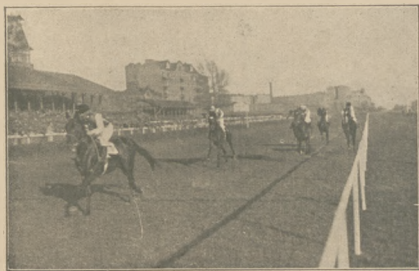
interesujące zdjęcie finiszu wyścigów konnych w Warszawie.