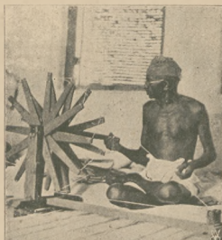
Mahatma indyjski przy swojej codziennej pracy.