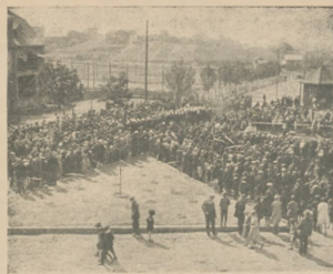
Uroczystość 3-go Maja w Grodzcu.