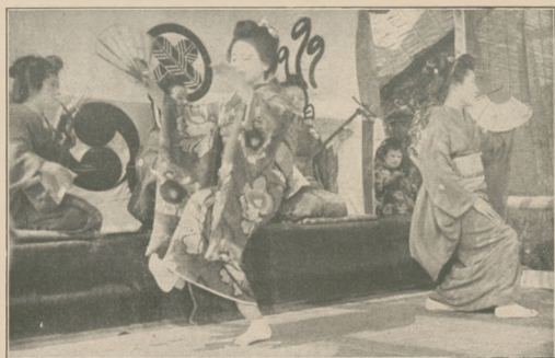
Tańce geisz przy akompaniamencie egzotycznych instrumentów.