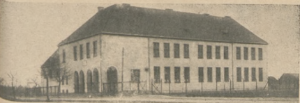
7-mio klasowa szkoła powszechna w Piotrkowie-Kujawskim, pow. Niezastawskiego.