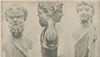
Posagi Hermyca jedynometrowej wysokości, znalezione w górze.