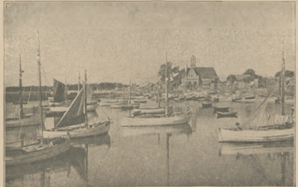
Port rybacki na Helu.