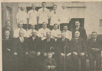
Komisja egzaminacyjna i kandydaci na mistrzów rzeźniczkich w Gdyni.