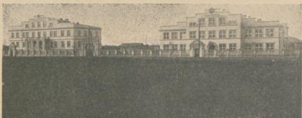
Nowowybudowany sierociniec i szkoła rzemiosł w Aleksandrowie Kujawskim, pow. Niezastawskiego.