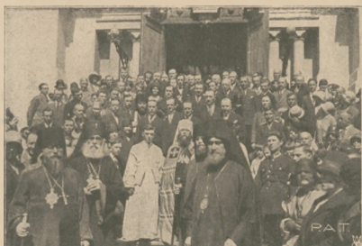
Zwołanie soboru prawosławnego. Metropolita Dyninzy i przedstawiciele rządu na uroczystym nabożeństwie w cerkwi w Warszawie na Pradze.