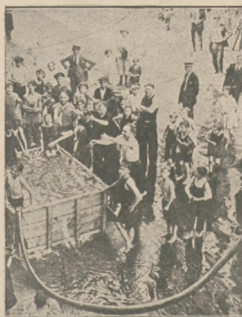
Na spokojniejszych ulicach Nowego Yorku ustawiono ogromne skrzynie z wodą, w których orzeźwiała się dziatwa, zmęczona upałem.