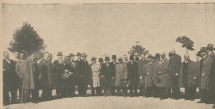
Zjazd burmistrzów woj. pomorskiego. Gdynia 31 maja 1930 r.