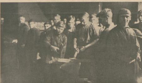
W kuźni szkoły rzemieślniczej w Olkuszu.