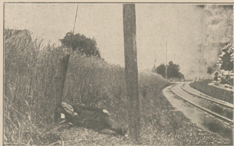
Siostra w cieniu łydy.