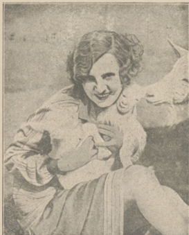
Słynna artystka filmowa Ossie Oswald na wakacjach.