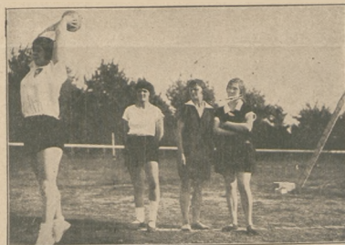
Rzut dyskiem na zawodach pań.