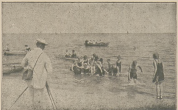
Nad polskim morzem.