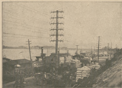
Główny rach przewozowy na Wiśle