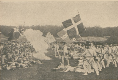
Odtworzenie bitwy francusko-angielskiej pod Dettington w angielskim obozie wojskowym w Aldershot.