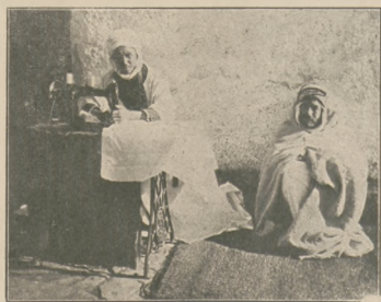
Maszyna do szycia stała się niezbędna w całym świecie. Zdjęcie przedstawia nam arabkę, szyciącą na maszynie.