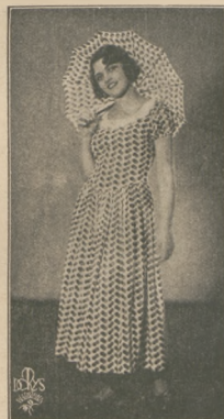
Cztery modele pięknych sukien leńskich perbalikowych, demonstrowanych przez panie z towarzyszytą na Balu Kola Polek w Warszawie.