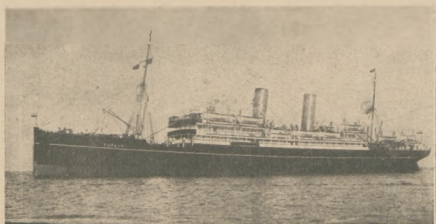
Polski statek transatlantyki „Pulaski”, który zawiązał z wycieczką amerykańską do portu gdynieckiego.