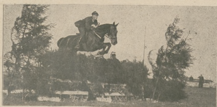
Z konkursów hippicznych w Warszawie. P. Zofja Chodźniewiczówna na przeszkodzie.