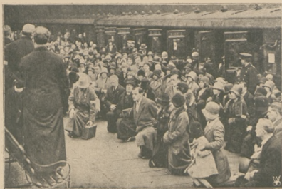
Odjazd z Londynu angielskiej pielgrzymki do Lourdes.