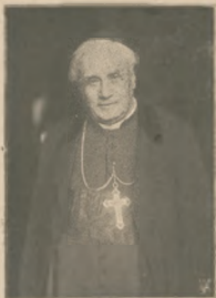
S. p. kardynał Luçon, zmarł w Reims.