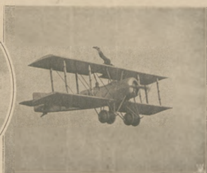
Popisy p. Kunow'a akrobata o żelaznych mięśniach i nerwach na samolocie podczas „Tygodnia Lotniczego” w Warszawie.