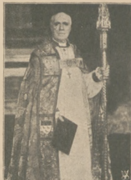
S. p. arcybiskup anglikański, lord Davidson, zmarł w Canterbury.