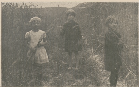
Zboża już „na chłopca” wysokie.