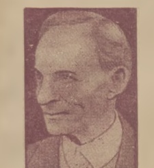
HENRYK FORD, największy wytwórca samochodów i miliardier amerykański, uległ nieszczęśliwemu wypadkowi samochodowemu.