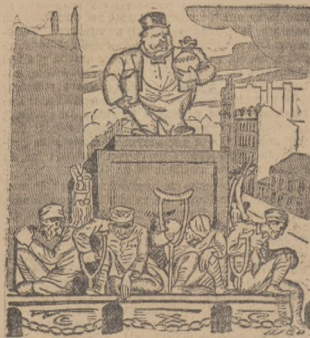
JEDYNY ZWYCIĘZCA — KAPITALIZM Projekt pomnika dla jednego zwycięzcy w wojnie światowej. ( „Politika”).