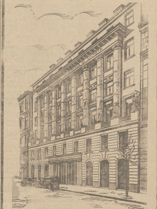
Uroczystość otwarcia gmachu odbyła się w dn. 23 b. m. przy udziale przedstawicieli Rządu, korpusu dyplomatycznego, władz samorządowych, a także przedstawicieli wielkiego przemysłu i handlu.

Wiadomo, iż przy istniejącym w Anglii systemie wyborczym odgrywa rolę każdy głos wyborcy, który może zawyżyć na szali. Już w ostatnich wyborach konserwatyści stwierdzili, że w summie 30-40 mandatów zdobyli tylko dzięki rewolucyjnej labourystyce z liberality. Większość adherentów lorda Beaverbrooka rekrutuje się z pośród konserwatyistów. Pojawienie się na widowni nowej konkurencyjnej partii godzi w jednolitość stroniwość konserwatyistów. I tu Baldwin polknął wielką, zreszt. nie zapomnianą przez „Kwintę praktycz. w”. W ubiegłym tygodniu Baldwin zawarł układ z lordem Beaverbrookiem, w którym akceptuje z pewnością zaszczerzanym program „Partii Jednoczenia Imperjum”, przyrzekając natychmiast po ewentualnym doj. się do władzy zwołać w tym celu konferencję rządów domniemych. Zasadniczą zaś kwestją ustalenia wy-