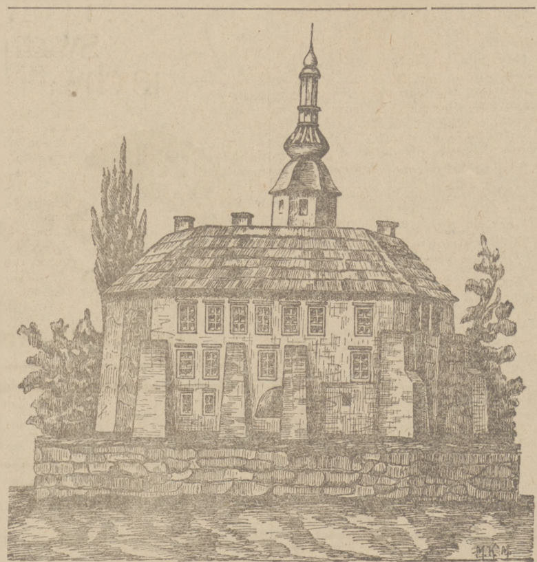
ZAMEK BISKUPI W SIEWIERZU wedł. stanu z r. 1710.

ówczesnego złotego polskiego wyrażały się jak 1:12. Za czasów Kajetana Soltyka, biskupa krak. i księcia Siewierskiego, mennica tutejsza wybija-