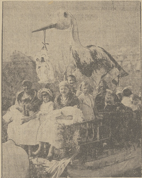
W Meranie urządzono pochod, przedstawiający symboliczne bajki. W pochodzie jechał w tłumie dzieci olbrzymi bocian.

prawdziwe BOROWIKI na wiankach, 1 kg. I gatunku tylko 5 zł. 50 gr. (najmniej 5 kg.) dostarcza „BORGRZYB”, Grodno, Magistracka 11. Przy odbiorze 10 kg. udzielamy 4 proc. rabatu.