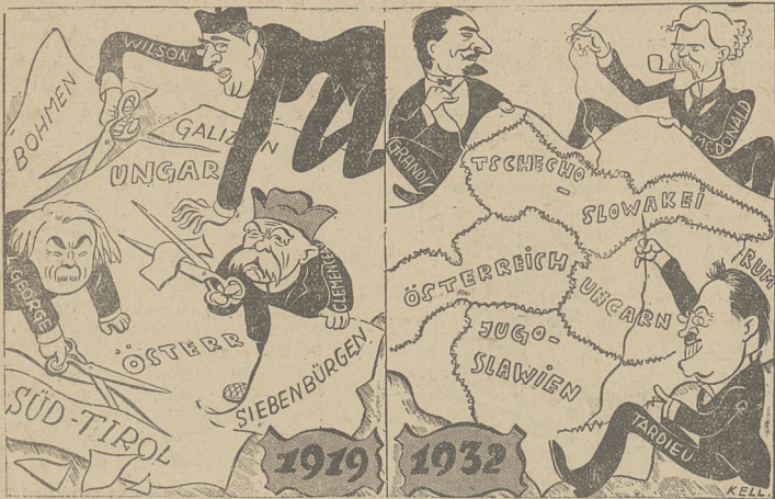
PROJEKT UNJI NADDUNAJSKIEJ W KARUKATURZE NIEMIECKIEJ.

Projekt utworzenia unji naddunajskiej wywołał w Niemczech wielkie zainteresowanie, które znalazło m. in. swój wyraz w powyższej karykaturze, zamieszczonej w pismach niemieckich. Karykatura p. t. „Międzynarodowa krawieczeni” przedstawia krajanie (1919) i zszycie (1932) mapy h. monarchji austriacko - węgierskiej.