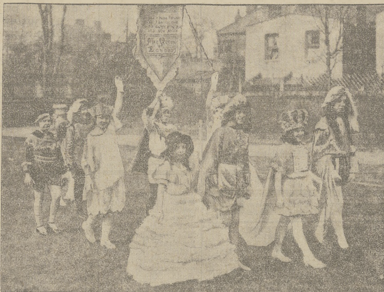
LONDYNSKA KRÓLOWA WIOSNY.