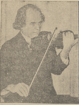
Slawny skrzypek czeski Jan Kubelik stracił cały swój majątek.

Kwiecień, więc wiosna w słońcu i pogodzie. O nowej sukni dumaj pełna główka. I radzą wspólnie o wiosennej modzie. Przeciwna nani i tej pokoiwka.