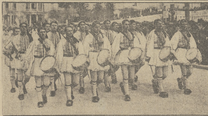
POMNIK NIEZNANEGO ŻOŁNIERZA W ATENACH.

W Atenach odsłonięto pomnik ku czci żołnierzy greckich, którzy padli w wojnach bałkańskiej, światowej i turecko-greckiej. Na grobowcu umieszczono płaskorzeźbę marmurową przedstawiającą starogreckiego żołnierza. Niżej widzimy oddział greckich strzelców górskich w pochodzie na odsłonięcie pomnika.