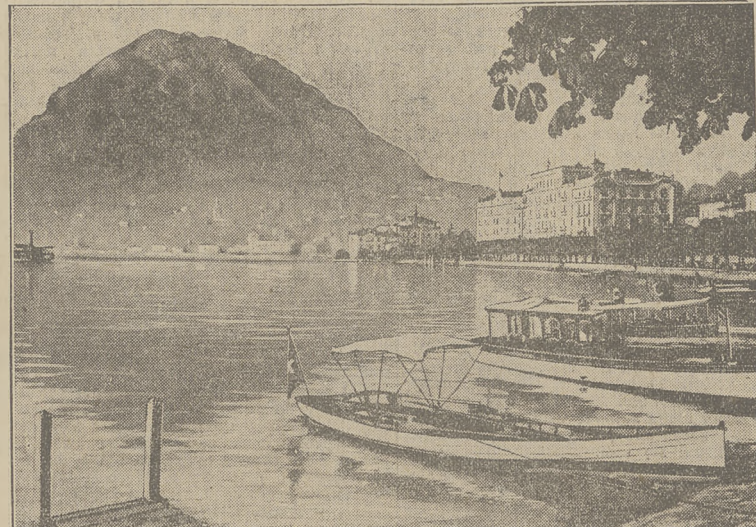
DRUGA KONFERENCJA DUNAJSKA odbędzie się dnia 25 bm. w Lugano, którego widok przedstawiamy.

Motywy tej odmowy są dotychczas nieznane. Organizatorzy odczytu żądno go urzędowego pisma w tej sprawie nie otrzymali.