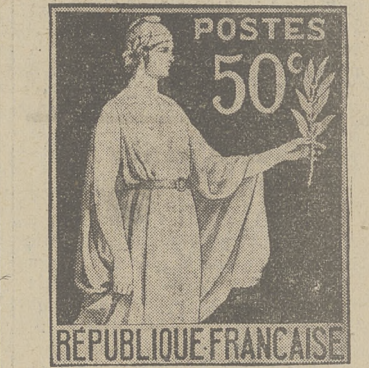
Nowy francuski znaczek pocztowy w stylu genewskiej konferencji rozbrojenkowej. O francuskim aniele pokoju mówią w Niemczech, że gałazkę oliwną trzyma w lewej ręce, a do czego ażjże prawej ręki, o tem jeszcze nie wie.