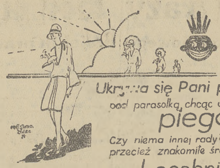
krem 3- mydło 1.55 wszędzie do nabycia

Ukryjcie się Pani przed słońcem pod parasolką, chcąc uchronić się przed piegami