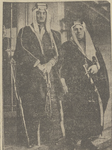
Król Hedżasu — Saud (z prawej) w towarzystwie tłumacza.

W przyszłym tygodniu do Warszawy przybywa egzotyczny władca, emir Fejsal, jako syn króla