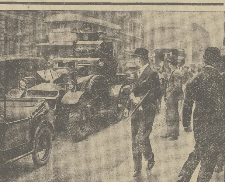
TANKI NA ULICY. Na ulicach Londynu dawne tanki służą policyi do regulowania ruchu ulicznego.

ła się w domu niejakiego Ciechoćńskiego. „Fabrykanta” przyłapano „in flagranti”, gdy pracował, pochylony nad kamienną płytą. Podczas rewizji znaleziono kulkę kłosa, różne farby, wałce pa-