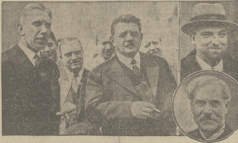
ROZMOWY LOZAŃSKIE. Von Papen i Herriot w czasie konferencji ski minister spraw zagranicznych Grandi. W kole Mac Donald.

politycznych. Wysiłek w tym kierunku, dokonany przez von Papena i Neuratha w czasie ich rozmowy z Anglikami, pozostał jednak bezskuteczny.