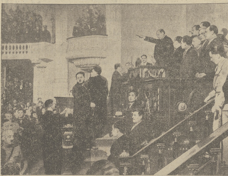
Nowy prezydent republiki meksykańskiej Abelardo Rodriguez składa przysięgę wobec deputowanych.

... daje każdemu możliwość spędzenia miłych chwil rozrywki i kontaktu z całym światem — w czterech ścianach swego pokoju.