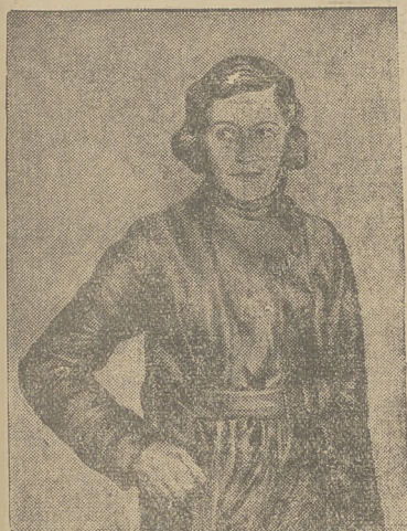
„DZIEWCZYNA Z NIEBA”

LONDYN, 19.11. Z Kairu donoszą, że według otrzymanych tam doniesień w Arabji miało wybuchnąć powstanie przeciw królowi Hedżasowi i Nedszemu, Ibn Saudowi. Podczas, gdy rząd Hedżasu twierdzi, że ruch powstańczy jest bez znaczenia, wiadomości z innych źródeł mówią o bardzo poważnym powstaniu, które przybiera groźny charakter. Przyopuszczają, że imię Jemenu popiera ruch powstańczy, zwrócony przeciw królowi Ibn Saudowi.