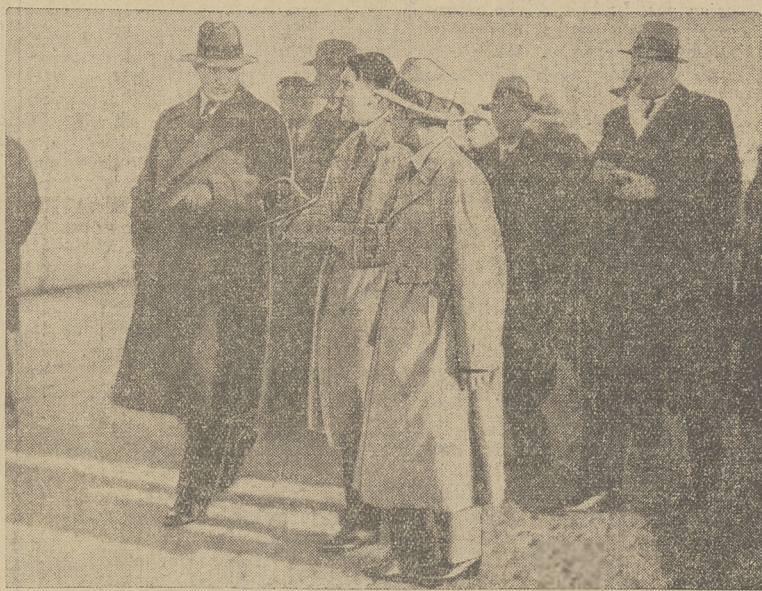
Adolf Hitler w przyjeździe do Berlina na konferencję z prezydentem Hindenburgiem.

pozycja przeciwko rządowi von Papena zdobyła olbrzymią większość, ale przy dzisiejszym układzie sił partyjnych jest rzeczą bardzo wątpliwą, by jakkolwiek większość mogła powstać na terenie parlamentu. Opozycja składa się ze zbyt różnorodnych żywiołów. Działa je zarówno różnic programowe, jak i metody działania. Nie bez znaczenia są także względy personalne. Aczkolwiek porozumienie nie jest zasadniczo wykluczone, nie mniej jednak następcza bardzo duże trudności.