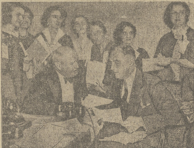
Prezydent Roosevelt rozpatruje z prezesem partii demokratycznej Farley'em rezultat wyborów. Obok 7 sekretarek prezydenta.

Jak wiadomo, sen. Wyrostek, jako adwokat, podjął się swego czasu załatwienia spraw podatkowych ks. Pszczyńskiego. Obiegają pogłoski, że sen. Wyrostek ma zamiar złożyć mandat senatorski.