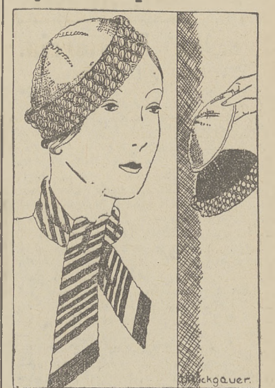
Czapeczka sportowa z czarnej wełny, biało obramowana i stosowany szal, które będą modne w nadchodzącym sezonie zimowym.