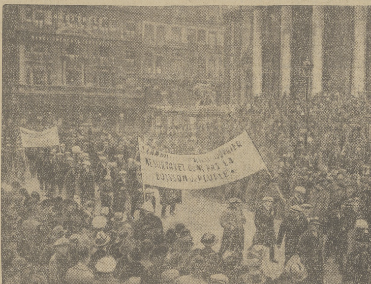
Brusela demonstruje przeciw projektowanej prohibicji.

sprawa zwrotu kosztów za przewóz dzieci polskich urzędników kolejowych na kolejach gdańskich; 5) skasowane będą wzajemne zakazy i zawieszania prasowe, stosowane do pism; 4) Gdańsk składa zobowiązanie, że zgodnie z konwencją paryską będzie dążył do unifikacji monetarnej z Polską, a wzajemnie Polska cofa swe zarządzenie o wprowadzeniu waluty polskiej na kolejach gdańskich.