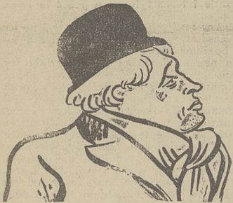
Paul Boncour w karykaturze francuskiej.

PARYŻ, 19.12. Paweł Boncour utworzył gabinet.