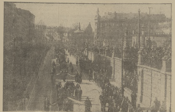
Korowód wleńców p.zed trumnami