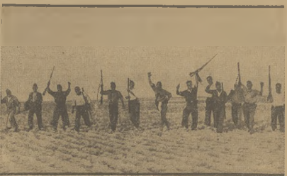
(Wiadomości z Hiszpanji podajemy na str. 2 i 6-ej)